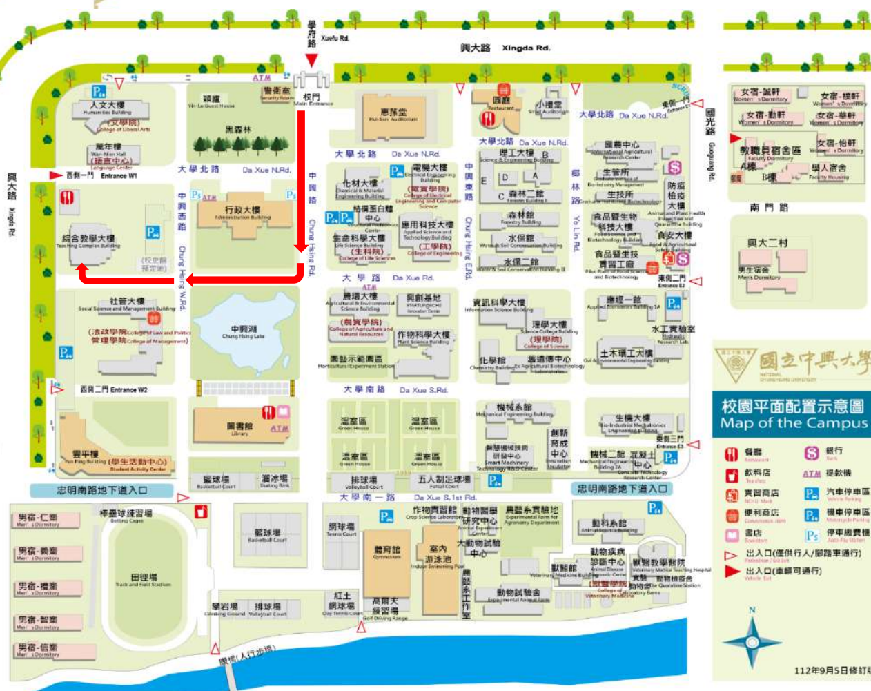
拾肆、進修學士班筆試考區位置圖(綜合教學大樓)校本部：